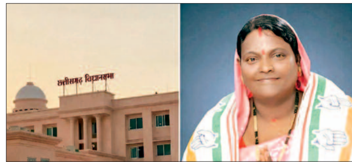
दिव्यांग पेंशन में बढ़ोतरी कर 1 हजार प्रतिमाह, रेडी टू ईट का संचालन महिला समूहों को देने सहित कई महत्वपूर्ण मुद्दों के प्रति विभागीय मंत्री का करारा ध्यानाकर्षण

टू ईट पोषण आहार के संचालन को महिला स्व-सहायता समूहों को देने की घोषणा की थी, जिससे महिलाओं को रोजगार भी मिलेगा और पोषण आहार की गुणवत्ता भी बेहतर होगी। लेकिन आज तक प्रदेश में इस व्यवस्था को प्रभावी ढंग से लागू नहीं किया जा सका है। उन्होंने कहा कि महिला समूहों को सशक्त बनाने के लिए की गई घोषणा केवल कागजों तक सीमित नहीं रहनी चाहिए, बल्कि उसे पूरी पारदर्शिता और गंभीरता के साथ लागू किया जाना चाहिए। विधायक ने कहा कि कई आंगनबाड़ी केंद्रों में चिकी और अन्य पोषण आहार की सप्लाई समय पर नहीं पहुंच रही है, जिससे बच्चों और गर्भवती